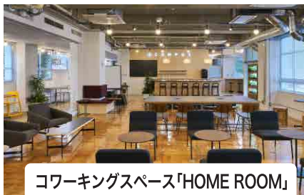
コワーキングスペース「HOME ROOM」