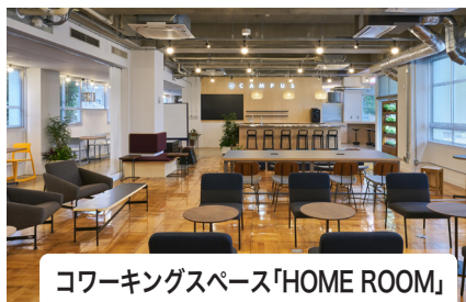
コワーキングスペース「HOME ROOM」